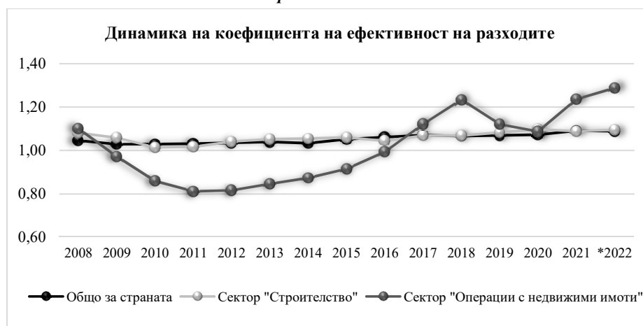
Фигура 6. Динамика на коефициента на ефективност на разходите на предприятията от секторите „Строителство“ и „Операции с недвижими имоти“ и общо за страната за периода 2008-2022 г.

Източник: Разработена от автора по данни на НСИ и собствени изчисления. https://infostat.nsi.bg/infostat/pages/reports/query.jsf?x_2=789 ; https://infostat.nsi.bg/infostat/pages/reports/query.jsf?x_2=1651 .