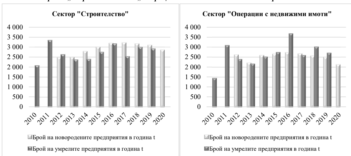
Фигура 4. Брой „новородени“ и „умрели“ предприятия в секторите „Строителство“ и „Операции с недвижими имоти“ за периода 2010-2020 г.

Източник: Разработена от автора по данни на НСИ https://infostat.nsi.bg/infostat/pages/reports/query.jsf?x_2=243 ; https://infostat.nsi.bg/infostat/pages/reports/query.jsf?x_2=1158 .