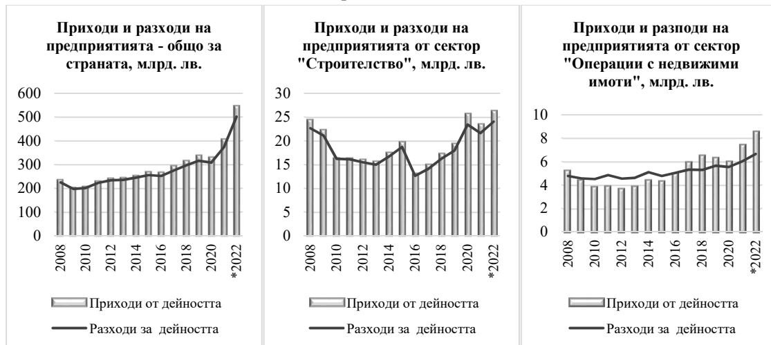
Фигура 5. Приходи от дейността и разходи за дейността на предприятията от секторите „Строителство“ и „Операции с недвижими имоти“ и общо за страната за периода 2008-2022 г.

Източник: Разработена от автора по данни на НСИ и собствени изчисления https://infostat.nsi.bg/infostat/pages/reports/query.jsf?x_2=789 ; https://infostat.nsi.bg/infostat/pages/reports/query.jsf?x_2=1651 .