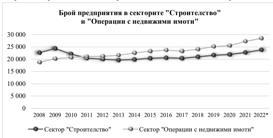
Фигура 1. Брой предприятия, осъществяващи стопанска дейност в секторите „Строителство“ и „Операции с недвижими имоти“ за периода 2008-2022 г.

Източник: Разработена от автора по данни от НСИ.